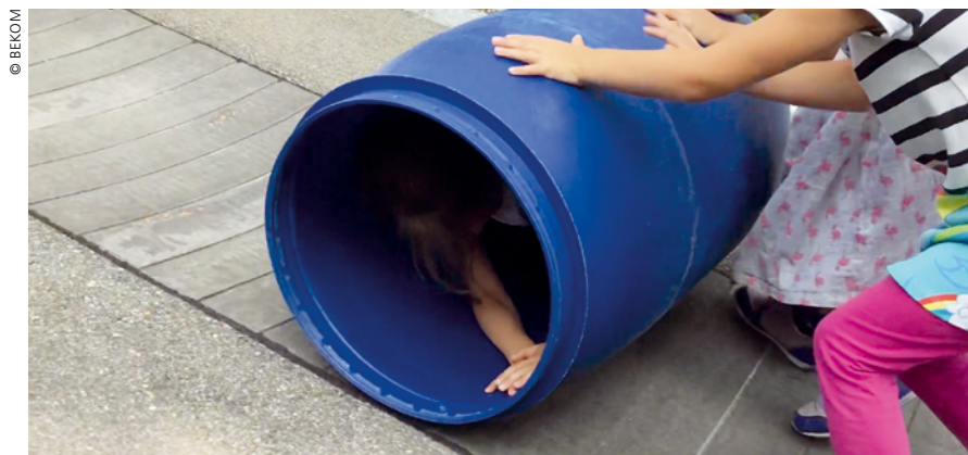
Unterwegs in urbanen und naturnahen Lebensräumen

winnen und mit andern zu kommunizieren. Nadine Madeira, Professorin an der Flinedner Fachhochschule Düsseldorf, begründet die bewegungsorientierte Sprachförderung in einem Interview so: «Im Rahmen der bewegungsorientierten Sprachbildung steht nicht nur die Stärkung der linguistischen Kompetenzen im Vordergrund, sie verfolgt auch eine ganzheitliche Perspektive auf den Spracherwerb und umfasst somit alle Sprachbereiche. Damit gemeint sind nicht nur die linguistischen Sprachbereiche – wie Wortschatz, Artikulation und Grammatik –, sondern auch die nonverbalen Ausdrucksmöglichkeiten sowie die Bedeutung prosodischer Anteile» (HfH, 2019).